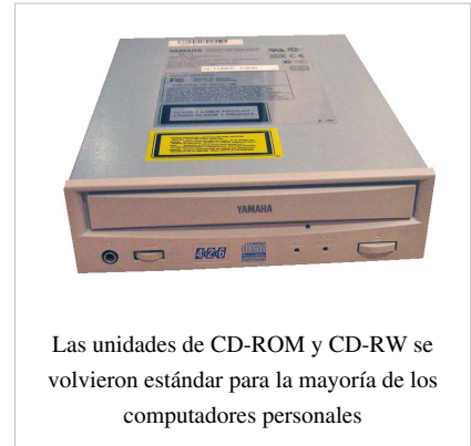
Las unidades de CD-ROM y CD-RW se volvieron estándar para la mayoría de los computadores personales

Los principios de los años 1990 vieron el advenimiento del CD-ROM como un estándar de la industria por venir, y a mediados de los años 1990 había uno incorporado en casi todos los computadores de escritorio y hacia el final de los años 1990, también en laptops. Aunque introducido en 1982, el CD-ROM fue en su mayor parte usado para el audio durante los años 1980, y entonces para los datos de computadora como con los sistemas operativos y aplicaciones en los años 1990. Otro popular uso de los CD-ROM en los años 1990 fue su uso multimedia, a medida que muchos computadores de escritorio comenzaron a incluir altavoces estéreo incorporados, capaces de reproducir música con calidad de CD y sonidos con la tarjeta de sonido Sound Blaster en los PC.